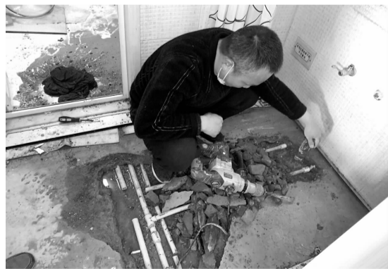
工人对漏水水管进行维修

“我们到现场后发现，楼上居民家中干湿分离洗手池下面的水管漏水严重，需要将水闸关掉进行维修。”社区工作人员说道。由于这两户居民都是租户，房屋维修需要告知房屋所有人，并在他们同意下进行维修。为了尽快解决居民的困难，社区工作人员联系了两户业主，漏水住户的业主在接到电话后，很快找来维修工人，对漏水管线进行