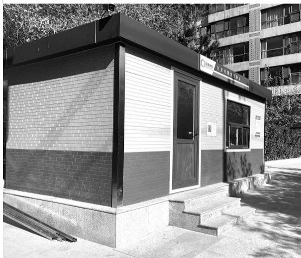
▲ 社区工作人员演示智能垃圾桶使用方式