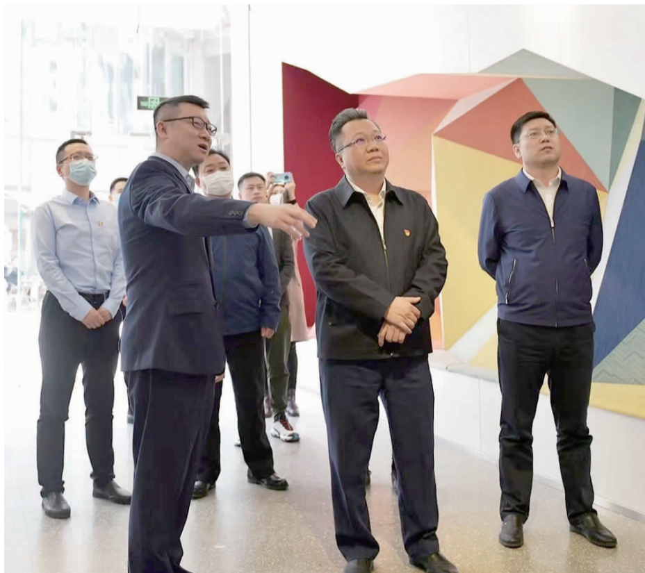
双井街道领导到蓝城兄弟公司走访调研