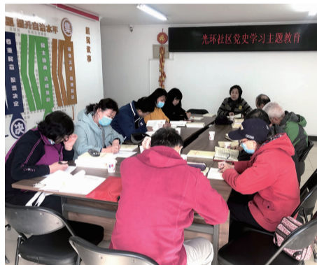
社区开展党史学习主题教育