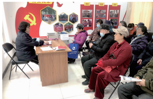
社区党支部成员以自学的形式学党史