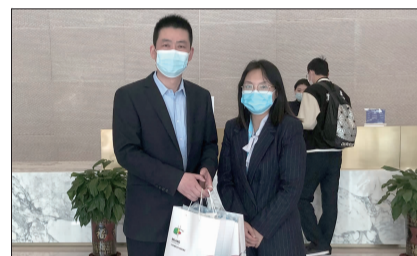
属地楼长向商务楼宇捐赠口罩