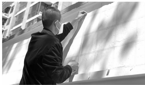
工作人员对墙面进行彩绘

目前,“井点2号”可回收垃圾站已经回收了12752kg的可回收物,为居民们带来了约8127元的收入,也相当于减少砍伐约96棵树,节约土地44平方米。“需要提醒大家,可接收的垃圾只有屏幕标注的14种可回收物,大家注意分类。”工作人员说道。 ■文/戴奕茹