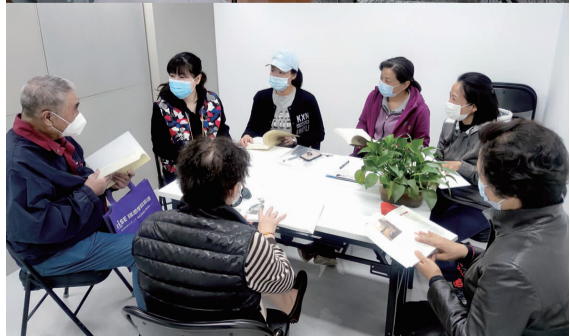
社区党员交流学习心得

2021年,注定会是一个不平凡的一年,中国共产党即将满100周岁了。100年来,我们党团结带领全国各族人民,完成了新民主主义和社会主义革命,进行了改革开放的伟大革命,如今,正朝着实现中华民族伟大复兴的中国梦昂扬前进。然而,学习党史,对于我们中共党员来说,既是一本厚重的教科书,也是一笔宝贵的精神财富。 ■文/戴奕茹