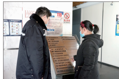
社区工作人员检查楼宇疫情防控工作