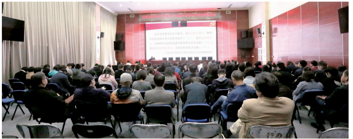
双井街道开展党史学习教育