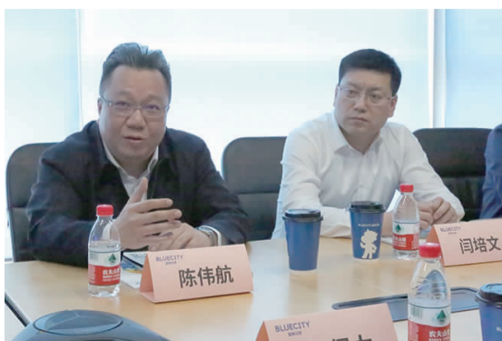
▲双井街道开展理论中心组(扩大)专题学习宣讲会