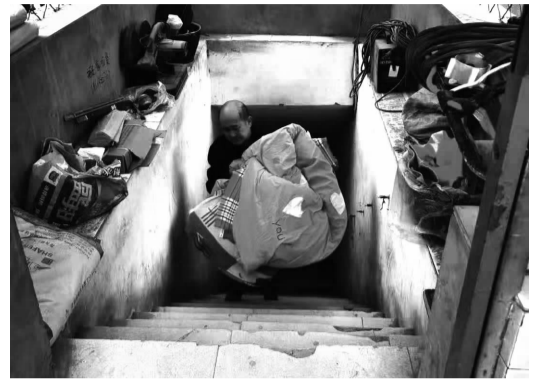
违法居住人员现场搬离地下室

“您现在居住的房屋是违法出租,我们要将其清退,请您收拾好自己的物品。”近日,双井街道办事处违法群租房治理办公室对辖区内违法出租的地下室开展清退整治,对双井地区的地下室开展综合整治。