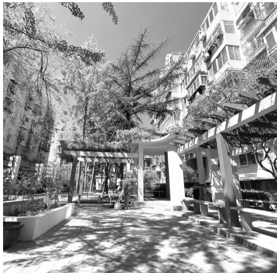
广和南里二条11号院鲜花盛开

同时,小区的入口处的自行车棚原本生锈的架子被漆成了彩色,黄绿相间的色泽充满了活力。而与它相隔不远的里8号院改造也在逐步进行中。施工人员正对小区的墙面进行彩绘工作,不久之后这里将会有一面“艺术墙”。