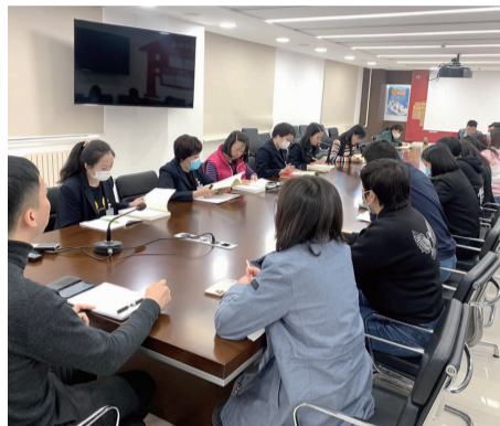
机关党支部成员开展党史教育自主学习