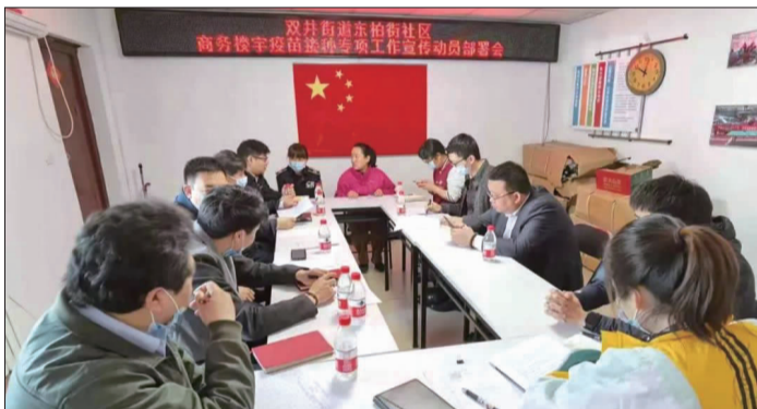
商务楼宇专项工作组与社区一同召开部署会